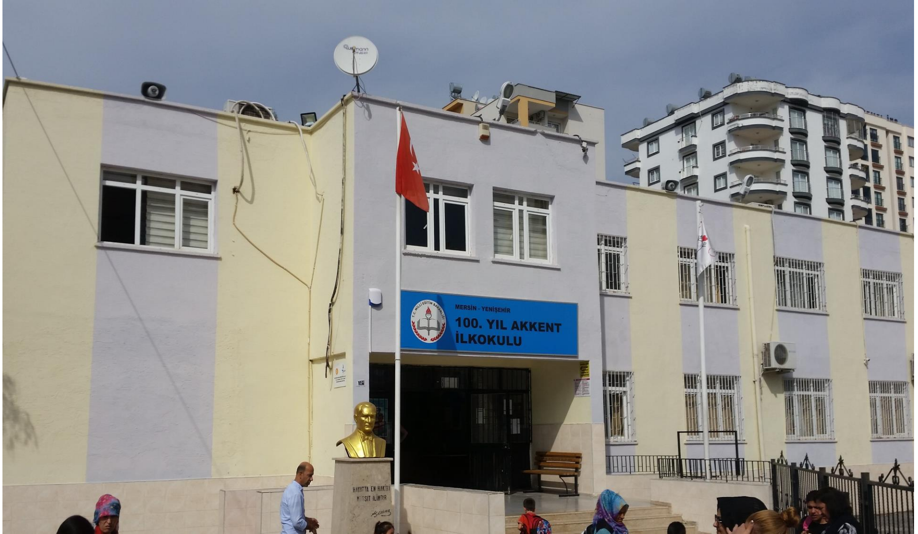
100.YIL AKKENT İLKOKULU